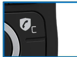
Touche de blocage des appels