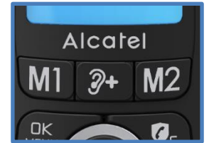
2 touches de mémoires directes